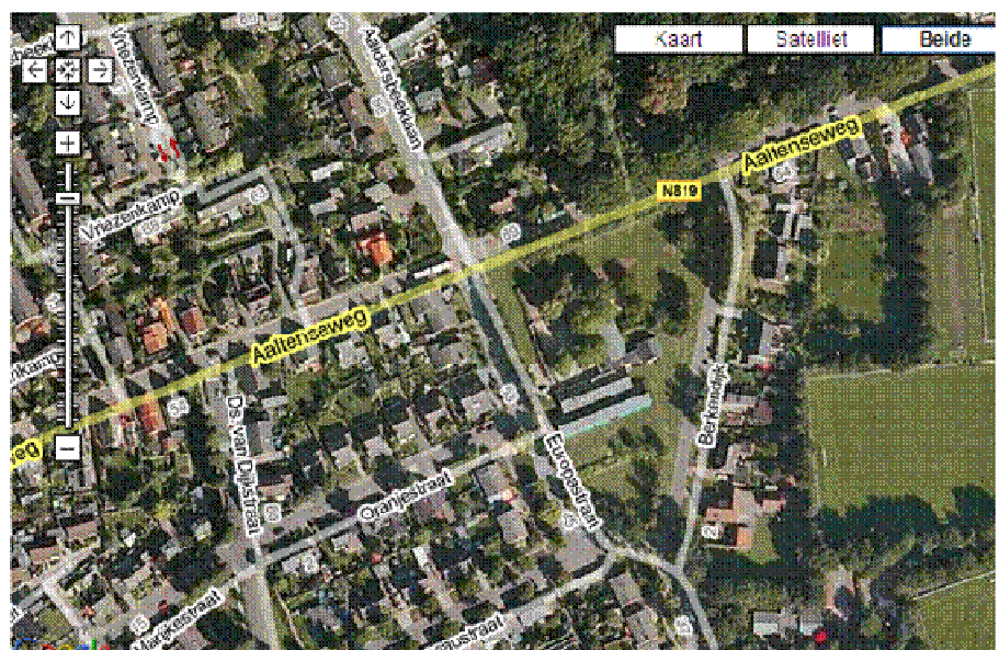
De locatie waar het om draait!

We hopen in een later stadium meer informatie te kunnen geven.