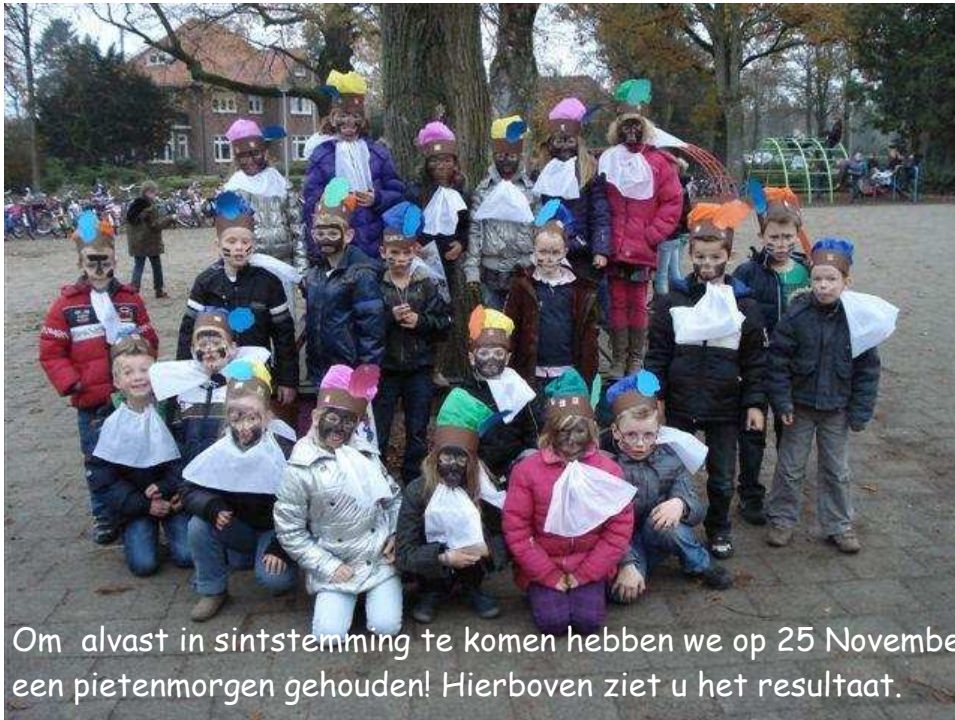
Om alvast in sintstemming te komen hebben we op 25 November een pietenmorgen gehouden! Hierboven ziet u het resultaat.